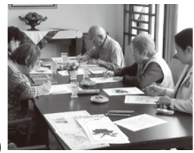
大人の塗り絵サークルはご入居の方 の中でも特に人気です。

今回はご入居者の方の日常 を少しご紹介。医・食・住 の全てを心地良く過ごして いただけるようにサポート しています。