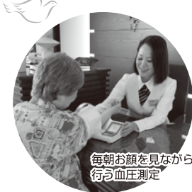
毎朝お顔を見ながら 行う血圧測定

今回はご入居者の方の日常 を少しご紹介。医・食・住 の全てを心地良く過ごして いただけるようにサポート しています。